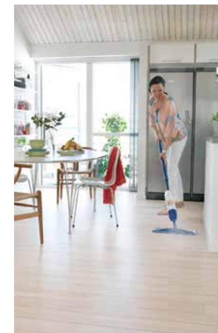
Vår bästsäljare: Bona Wood Floor Spray Mop