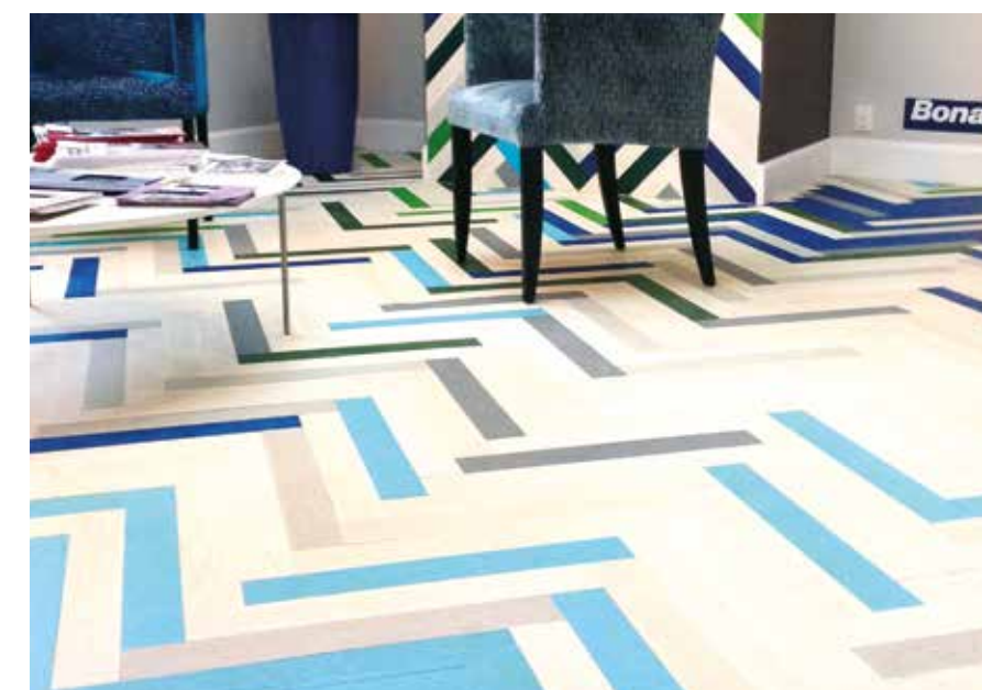
Badalona Home Design Fair, Spanien

Tillsammans med Decus Parquet Badalona stod Bona för renoveringen och omarbetningen av flera golvet. Ett exempel var bibliotekets ekgolvet som fick både skydd och en färgstark design med Bona Traffic, Bona Sportive linjemarkeringsfärg och Bona Naturale 2-comp.