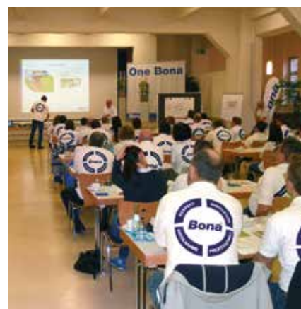
Bonas medarbetare i dialoger för One Bona

Genom dialoger med alla medarbetare hoppas vi kunna skapa det engagemang och den förståelse som krävs för att CSR ska bli en naturlig del av Bona. Under arbetsplatsträffar har vi brutit ned övergripande CSR-mål till individuella mål på varje avdelning så att alla kan bidra till vår långsiktiga hållbarhetsplan.