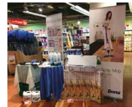
Bonas produkter i en Sparbutik i Österrike