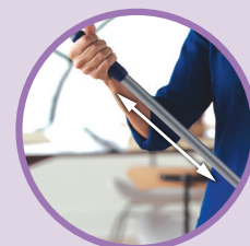
MÂNER TELESCOPIC Adaptabil la Înălțimea Preferată

Mopul din microfibră Bona Pet System Premium este cea mai bună unealtă de curățare a podelelor pentru casele cu animale de companie. Acest mop ușor și durabil este prevăzut cu două lavete din microfibră, fiecare fiind concepută pentru curățarea murdăriei produse de animalele de companie.