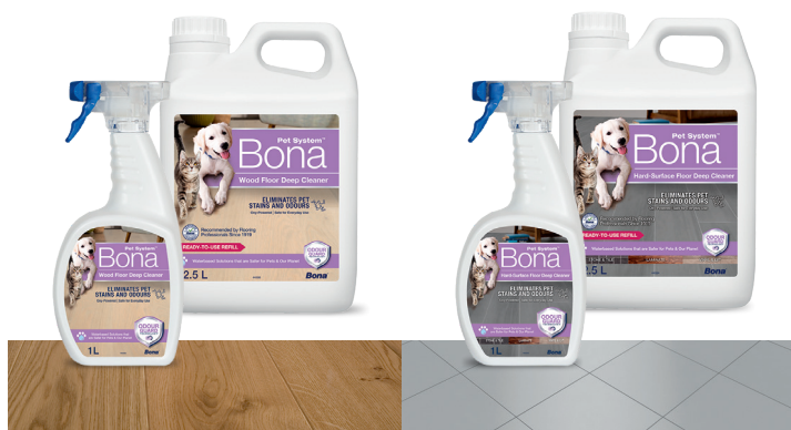
Deep Cleaner Pardoseli din Lemn

Alegeți formula adecvată tipului dvs. de pardoseală