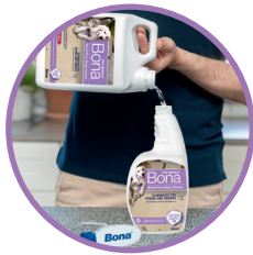
REUMPLERE ECONOMICĂ Pentru toate Recipientele Bona