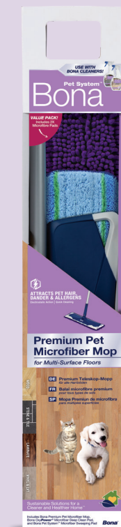
Deep Cleaner Pardoseli Dure