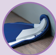
COLȚURI MOI ȘI FLEXIBILE Protejează Mobilierul și Plintele