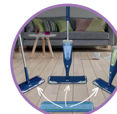
LAVETE COMPATIBILE CU TOATE MOPURILE BONA