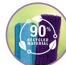
LAVETE REALIZATE 90% DIN MATERIALE RECICLATE & LAVABILE DE PÂNĂ LA 500 DE ORI