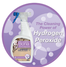
FORMULĂ OXIGENATĂ Pentru Curățare Profundă