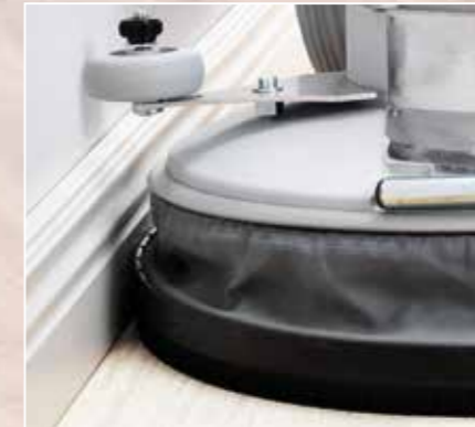
DICHTER TOT AAN DE MUUR