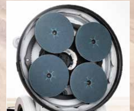
DICHTER TOT AAN DE KANTEN