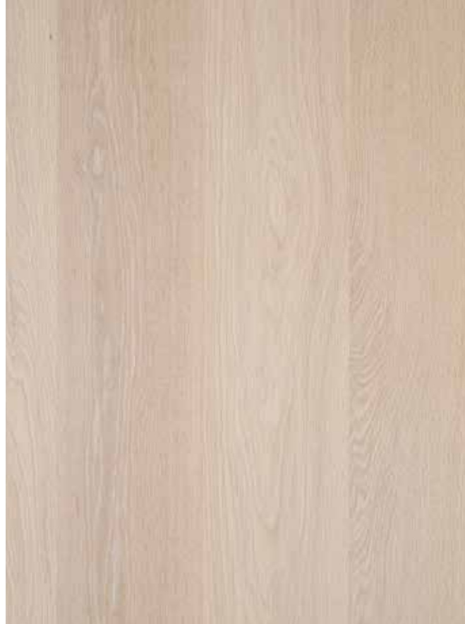
Nordic Frost auf gebürsteter Eiche. Die Ergebnisse können je nach Farbe und Art des Originalholzes variieren.

Die feinen weißen Pigmente im Öl unterstreichen die Schönheit Ihres natürlichen Holzbodens.