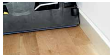
Het unieke ontwerp stelt de machine in staat om tot vlakbij de muren te reinigen