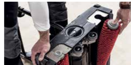
Inklikbare verticale contra-rotterende borstels zorgen voor maximale reinigingsefficiëntie

De nieuwe Bona PowerScrubber 2.0 maakt gebruik van dezelfde technologie als de originele Bona PowerScrubber. De ge-update versie heeft een groot aantal nieuwe, gebruiksvriendelijke functies en een fris, nieuw ontwerp - in de lijn met de andere Bona Machines.