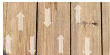
Bona PowerScrubber's effectieve reiniging dringt diep door tot in de houtvezels