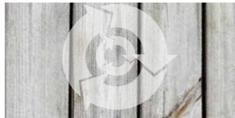
Met circulair borstelen met normale hogedrukreinigers wordt er niet zo goed schoongemaakt en het kan sporen achterlaten

Het Bona Deep Clean Systeem voor de professionele, grondige reiniging - nu met de nieuwe Bona PowerScrubber 2.0 voor nog meer veelzijdigheid en gemak. Roterende borstels zorgen voor een diepe, effectieve reiniging, terwijl het krachtige maar compacte ontwerp van de Bona PowerScrubber 2.0 nog betere prestaties levert dan de meeste automatische schrobzuigmachines. Verdere voordelen zijn de ergonomische bediening, het makkelijk in elkaar zetten en het transport. Verouderde houten vloeren schuren is niet ideaal omdat je dan het verouderde effect kan verwijderen, daarom is Bona Deep Cleaning dé ideale oplossing!