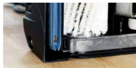
De uitstekende kracht van de rubberen zuigbalken laat geen waterresidu achter op de vloer