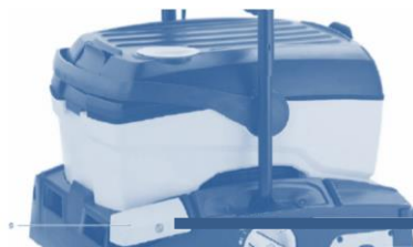
Pédale abaissement barre d'aspiration

Veiller qu'il n'y ait pas d'accumulation d'eau sur la surface (éclaboussures ou endroits où la machine n'aurait pas entièrement aspiré le produit nettoyant). Immédiatement enlever les éventuelles flaques d'eau à l'aide d'un torchon/serpillière.