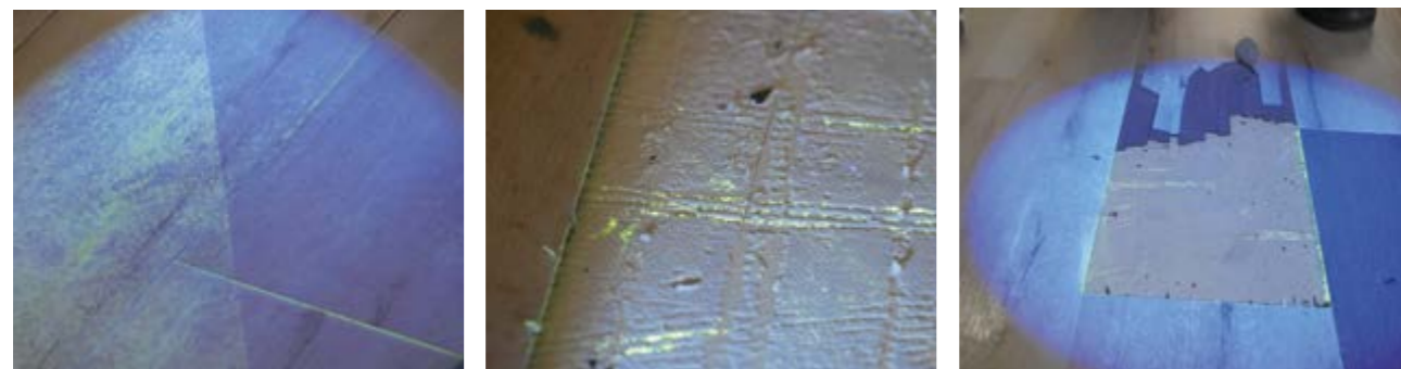
Pavimento iluminado com lâmpadas de luz ultravioleta para detetar a presença de contaminantes.

Ao aplicar uma camada de Bona Pure sobre o pavimento de LVT, a Bona cumpriu as exigências especificadas pelo regulamento TRBA 250. A sua capacidade de selagem e a sua resistência ótima contra o escorregamento criam uma barreira face aos micro-organismos e germes residuais, o que permite desfrutar de uns pavimentos higiénicos. A aplicação de Bona Pure sobre os pavimentos de vinilo facilita também a limpeza de manutenção.